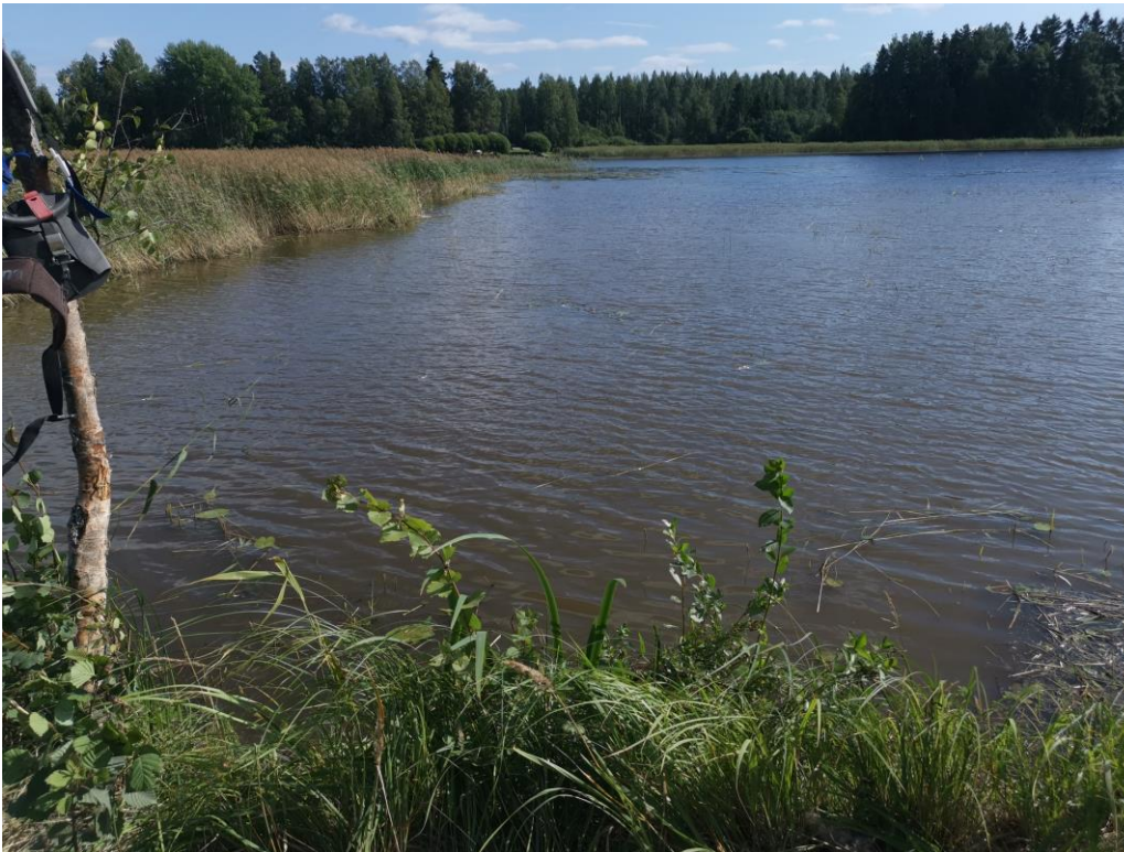
Kuva 2: Ajosaaren niittoalue niiton aikana ja jälkeen.